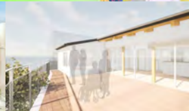
たまよん完成イメージ図①